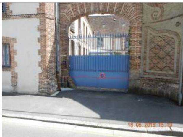
La ligne rouge représente le niveau d'eau en 2001

Altitude calculée de l'eau (en m) : 199.42