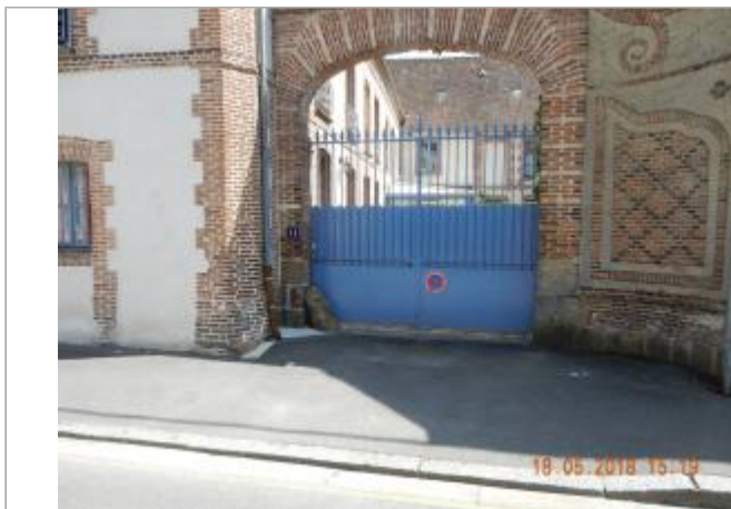
Portail du 11 rue des Tanneurs