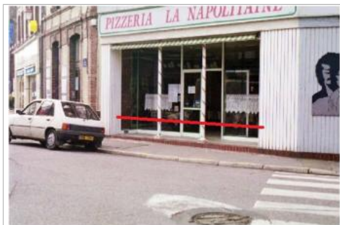
Ancienne pizzeria présente en 2001, le trait rouge représente le niveau d'eau atteint (source : SPC SACN)

Altitude calculée de l'eau (en m) : 200.17