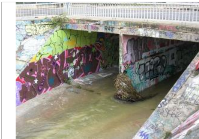
Vue sur le magasin de rénovation du bâti