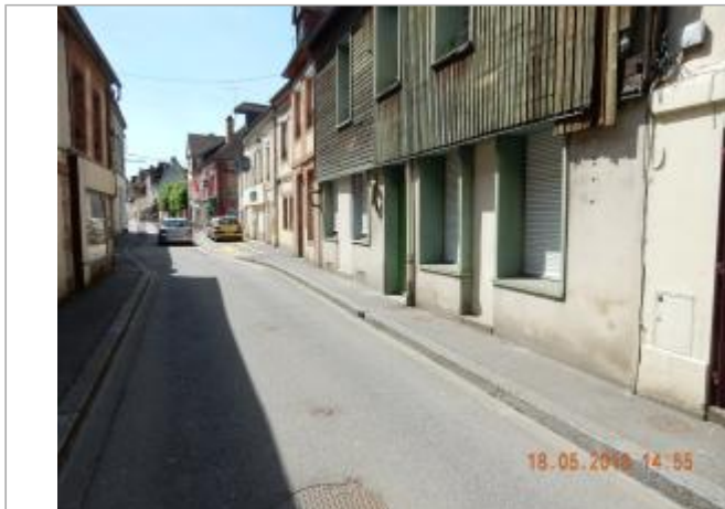
Vue sur l'habitation depuis la rue