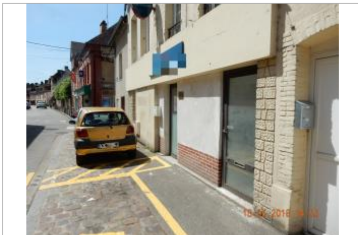
Cabinet de radiologie au 7 rue du Moulin