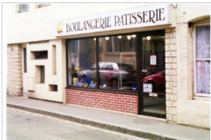
Vue sur la boulangerie de l'époque. 10 cm d'eau dans le magasin en 2001

Altitude calculée de l'eau (en m) : 198.97 m