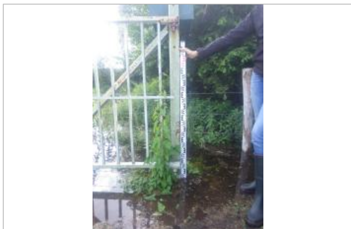
Niveau d'eau arrivé à la base du poteau soutenant le portail

SOURCE DE REPÉRAGE : CAMPAGNE DE TERRAIN SIBVR - 15 JUIN 2018 - 15/06/2018