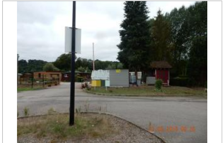
Entrée du camping