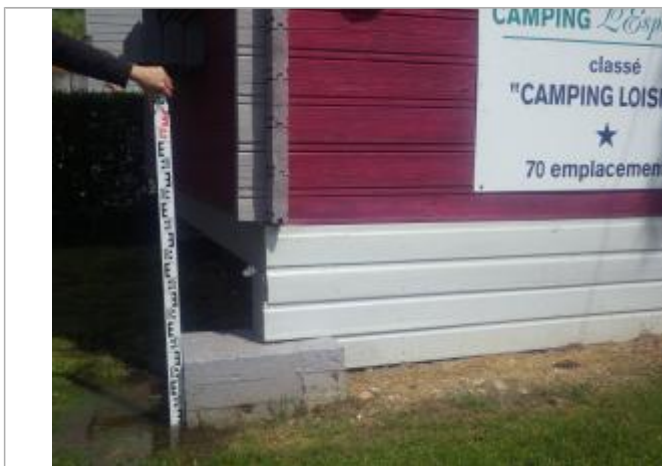
Mesure du niveau d'eau au pied du local

Maximum de l'inondation : Oui Visibilité : Oui État du repère : Bon Pérennité : Moyenne