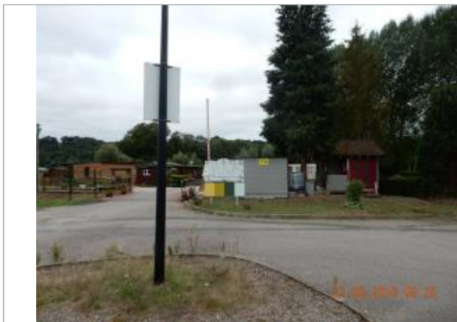
Entrée du camping