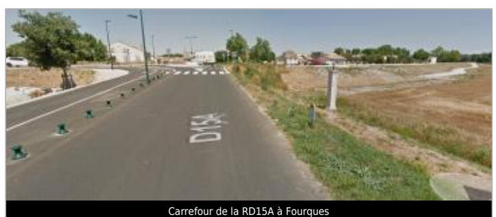
Carrefour de la RD15A à Fourques

GÉOLOCALISATION Coordonnées WGS84 : X: 4.61165660 / Y: 43.69144000 Coordonnées RGF93 (Lambert 93) X: 829955.65 / Y: 6289371.43 Coordonnées RGF93 (ETRS89) : X: 4.6116566 / Y: 43.69144 Code Hydro: V---0000 Rive de référence: