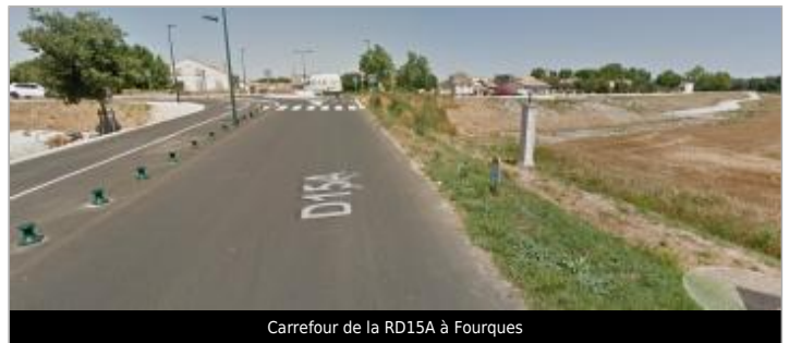
Carrefour de la RD15A à Fourques

GÉOLOCALISATION Coordonnées WGS84 : X: 4.61165660 / Y: 43.69144000 Coordonnées RGF93 (Lambert 93) X: 829955.65 / Y: 6289371.43 Coordonnées RGF93 (ETRS89) : X: 4.6116566 / Y: 43.69144 Code Hydro: V---0000 Rive de référence: