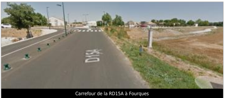
Carrefour de la RD15A à Fourques

GÉOLOCALISATION Coordonnées WGS84 : X: 4.61165660 / Y: 43.69144000 Coordonnées RGF93 (Lambert 93) X: 829955.65 / Y: 6289371.43 Coordonnées RGF93 (ETRS89) : X: 4.6116566 / Y: 43.69144 Code Hydro: V---0000 Rive de référence: