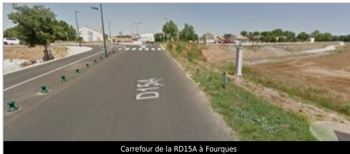
Carrefour de la RD15A à Fourques