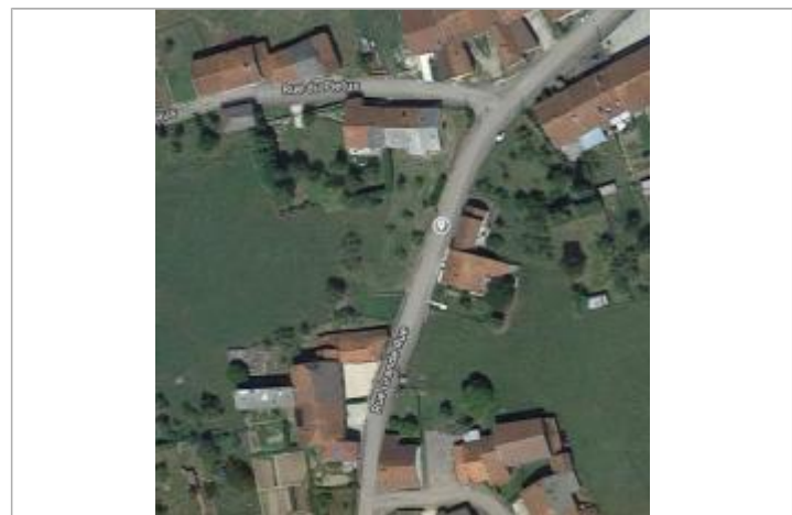
Localisation de la limite d'inondation