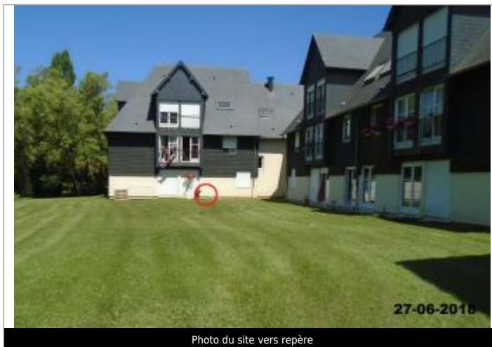
Photo du site vers repère