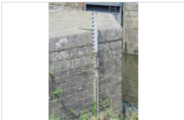
Echelle limnimétrique aval de l'écluse de la Molière à Saint-Senoux

Altitude calculée de l'eau (en m) : 12.895 m