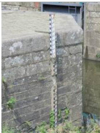
Echelle limnimétrique aval de l'écluse de la Molière à Saint-Senoux

Altitude calculée de l'eau (en m) : 12.725 m