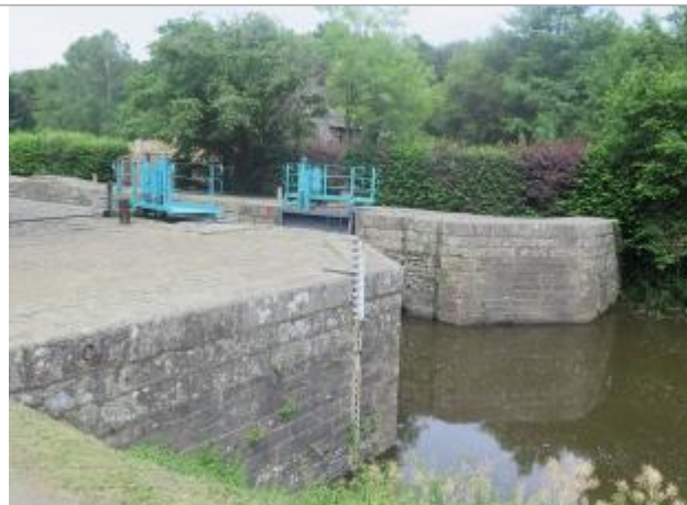
Aval de l'écluse de la Molière à Saint-Senoux

Coordonnées WGS84 : X: -1.76542700 / Y: 47.91039250