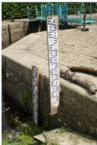
Echelle limnimétrique amont de l'écluse de la Molière à Saint-Senoux

Altitude calculée de l'eau (en m) : 12.984 m