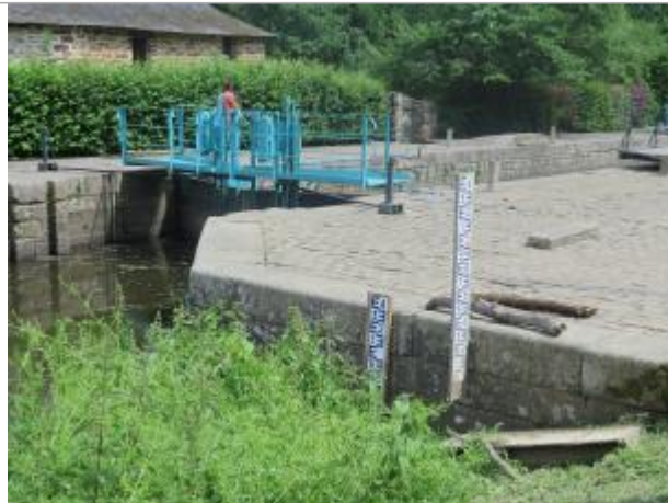
Amont de l'écluse de la Molière à Saint-Senoux