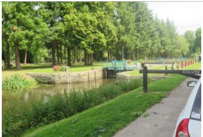
Amont de l'écluse de Gailieu à Guichen