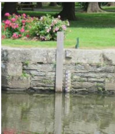
Echelle limnimétrique à l'amont de l'écluse de Gailieu à Guichen

Altitude calculée de l'eau (en m) : 14.021 m