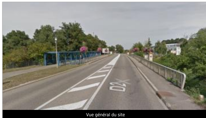
Vue général du site