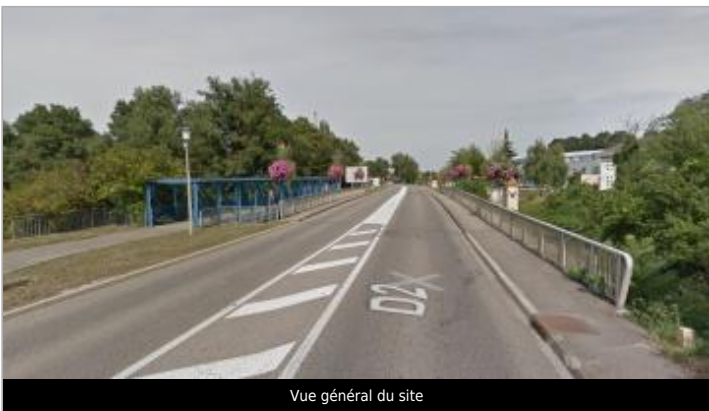
Vue général du site

GÉOLOCALISATION Coordonnées WGS84 : X: 7.34854270 / Y: 47.86717700 Coordonnées RGF93 (Lambert 93) X: 1024961 / Y: 6760814.95 Coordonnées RGF93 (ETRS89) : X: 7.3485427 / Y: 47.867177 Code Hydro : A---0030 Rive de référence :