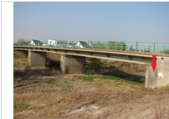
Vue général du site

Coordonnées WGS84 : X: 7.38105000 / Y: 47.94016600