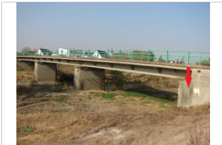
Vue général du site