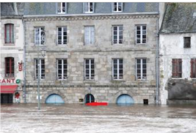
Photographie prise à 15:31 le 24/12/2013