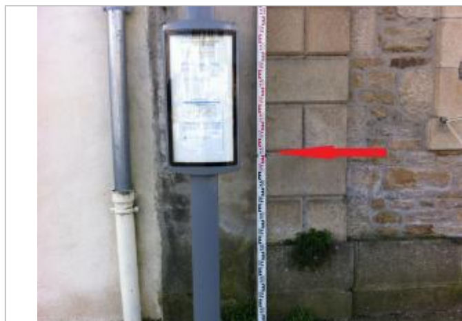
Angle du 12 Quai Brizeux au niveau de l'arrêt de bus

Altitude calculée de l'eau (en m) : 4.73