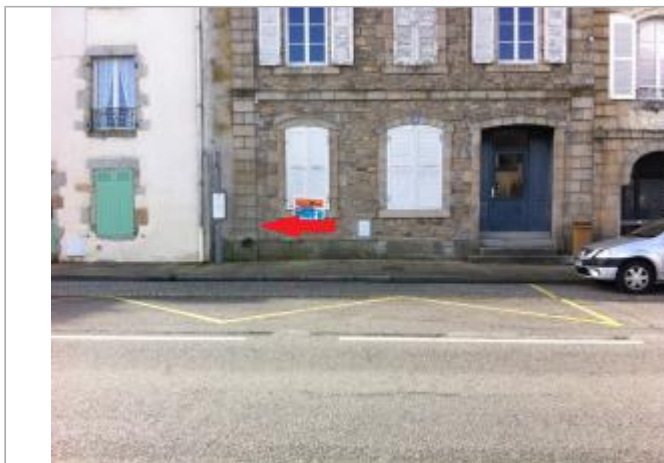
Angle du 12 Quai Brizeux au niveau de l'arrêt de bus