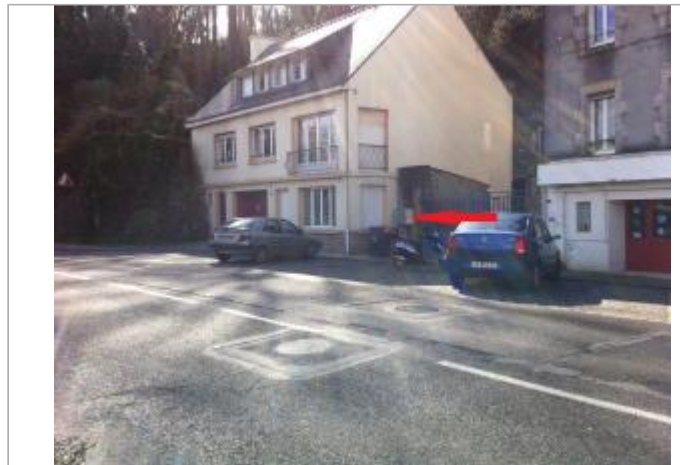
15T Quai Brizeux