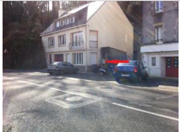
15T Quai Brizeux

Coordonnées WGS84 : X: -3.54563880 / Y: 47.86992300