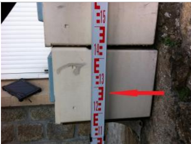
Boîtes aux lettres au 15T Quai Brizeux

Altitude calculée de l'eau (en m) : 4.34 m