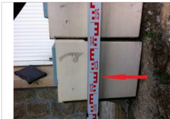
Boîtes aux lettres au 15T Quai Brizeux

Altitude calculée de l'eau (en m) : 4.34 m