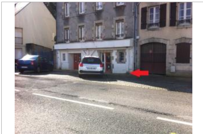
Angle du 15 Quai Brizeux

GÉOLOCALISATION Coordonnées WGS84 : X: -3.54566660 / Y: 47.87006220 Coordonnées RGF93 (Lambert 93) X: 211190.27 / Y: 6772457.08 Coordonnées RGF93 (ETRS89) : X: -3.5456666 / Y: 47.8700622 Code Hydro: _ELAITA_ Rive de référence: Droite