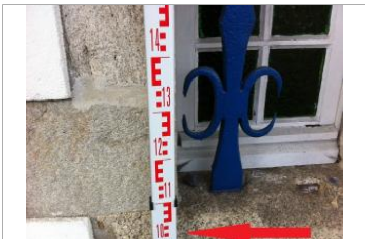
Petite fenêtre à l'angle du 15 Quai Brizeux

MARQUE Texte : Niveau déduit d'une photographie Maximum de l'inondation : Non Visibilité : Non État du repère : Disparu Pérennité : Aucune