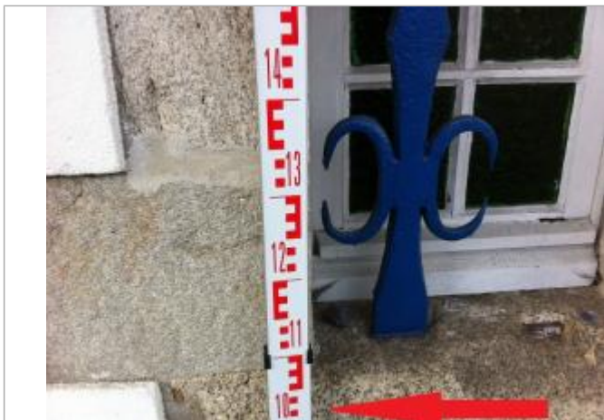
Petite fenêtre à l'angle du 15 Quai Brizeux