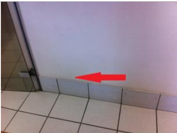
Plancher au niveau de la plinthe

Altitude calculée de l'eau (en m) : 4.65