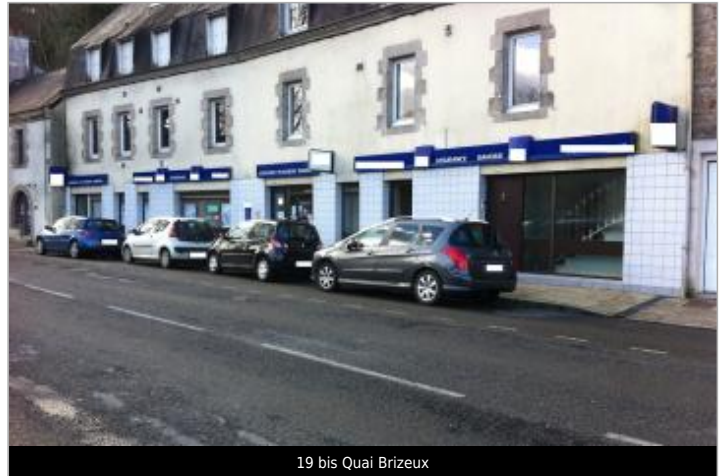
19 bis Quai Brizeux

Coordonnées WGS84 : X: -3.54490550 / Y: 47.86876510