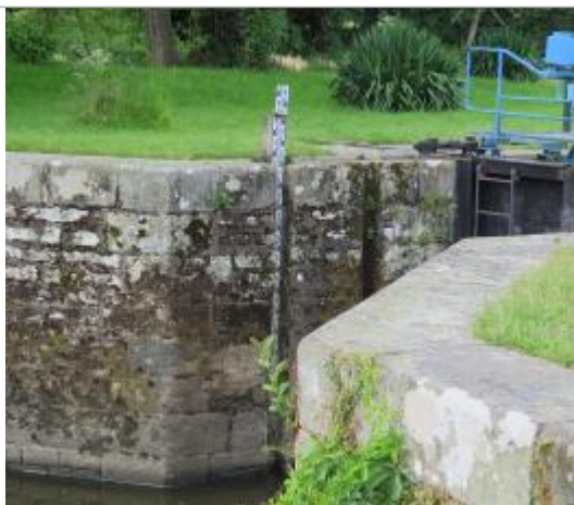
Echelle limnimétrique à l'aval de l'écluse de Pont-Réan à Bruz

Altitude calculée de l'eau (en m) : 18.141 m