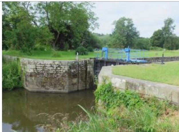
Vue générale de l'aval de l'écluse de Pont-Réan à Bruz