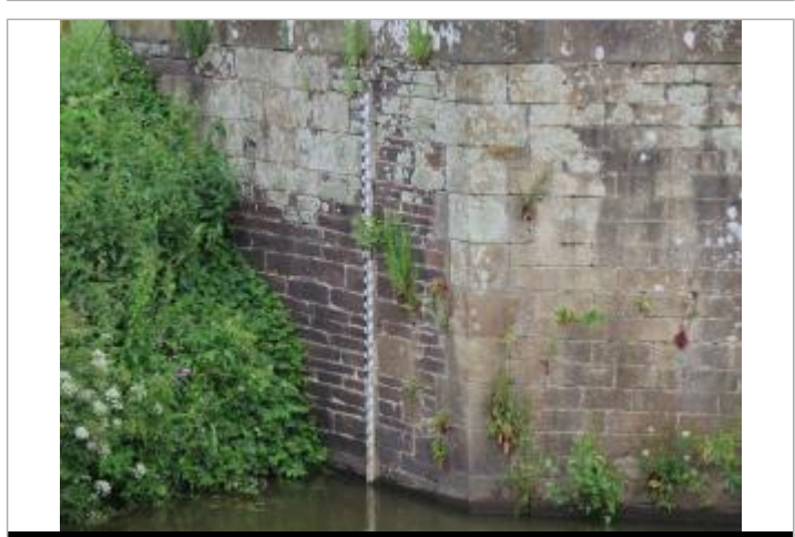
Echelle limnimétrique à l'aval de l'écluse de Cicé à Bruz

GÉNÉRAL Code : SPC Cicé mars 2001 Date de mise à jour : 20/12/2018 Auteur : SPC VCB