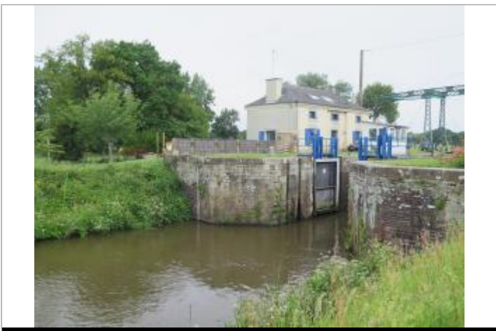
Vue générale de l'aval de l'écluse de Cicé à Bruz

GÉOLOCALISATION Coordonnées WGS84 : X: -1.76689160 / Y: 48.05081320 Coordonnées RGF93 (Lambert 93) X: 345043.76 / Y: 6782987.7 Coordonnées RGF93 (ETRS89) : X: -1.7668916 / Y: 48.0508132 Code Hydro: J---0060 Rive de référence: Droite