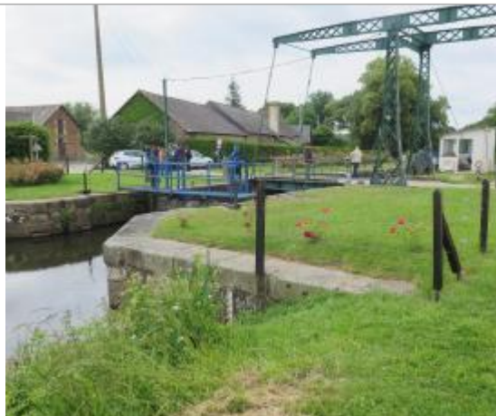
Vue générale de l'amont de l'écluse de Cicé à Bruz

Coordonnées WGS84 : X: -1.76673050 / Y: 48.05120500