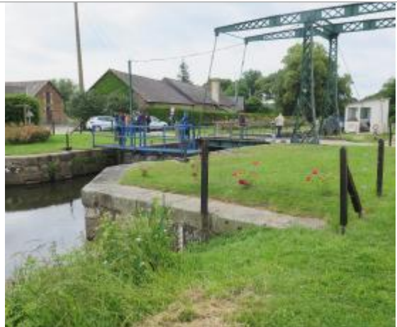
Vue générale de l'amont de l'écluse de Cicé à Bruz

Coordonnées WGS84 : X: -1.76673050 / Y: 48.05120500