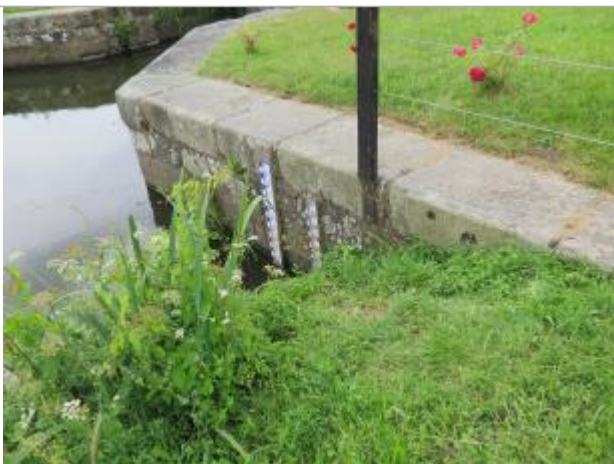
Echelle limnimétrique à l'amont de l'écluse de Cicé à Bruz

Altitude calculée de l'eau (en m) : 21.269 m