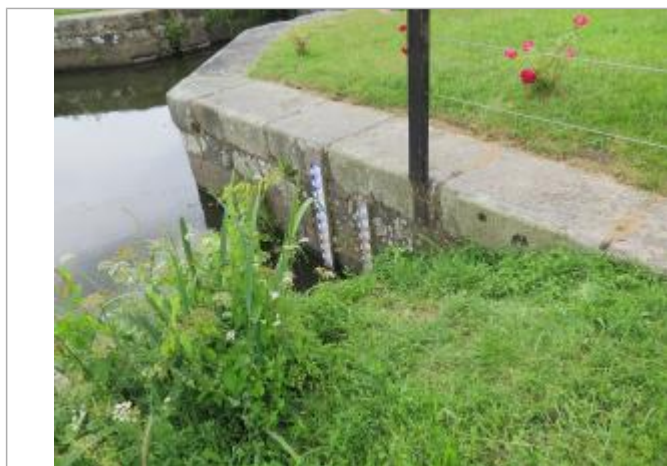
Echelle limnimétrique à l'amont de l'écluse de Cicé à Bruz

Altitude calculée de l'eau (en m) : 21.249 m