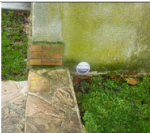
Salle des fêtes

Texte : Mars 1978 plus hautes eaux connues l'Yerres