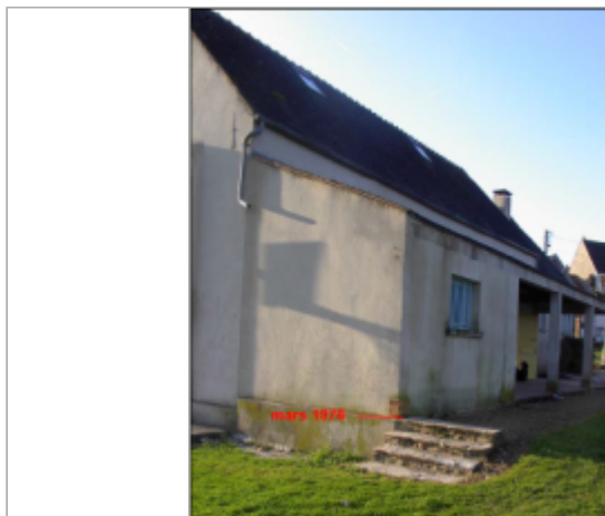
Salle des fêtes

Coordonnées WGS84 : X: 2.93864100 / Y: 48.67506300