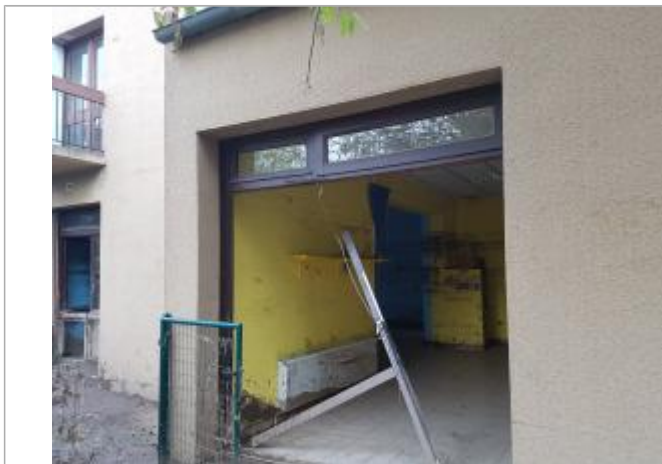
Traces de boue indiquant le niveau maxi