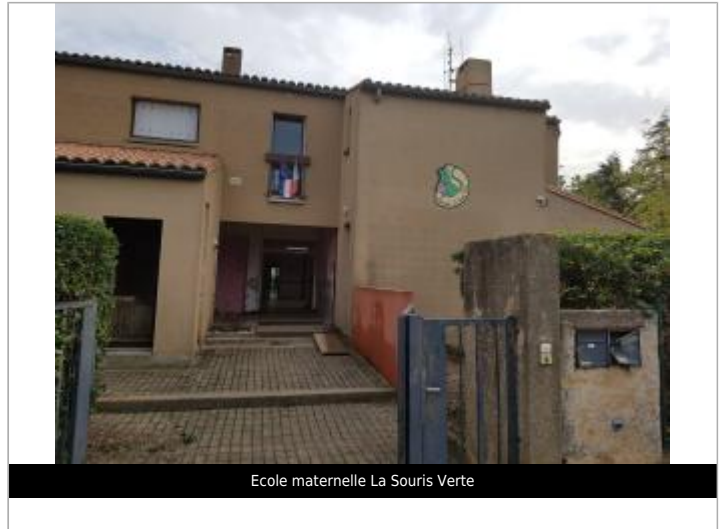
Ecole maternelle La Souris Verte