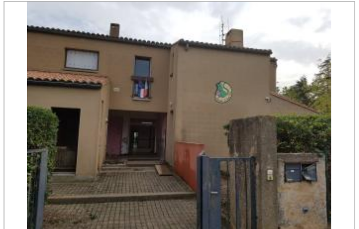
Ecole maternelle La Souris Verte