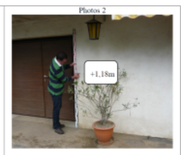
Trace sur la façade à côté de la porte de garage du 41 Ter Grande Rue

SOURCE DE REPÉRAGE : DDT 54 (MAI 2012) - 22/05/2012 Type de repérage : Campagne de terrain post-inondation