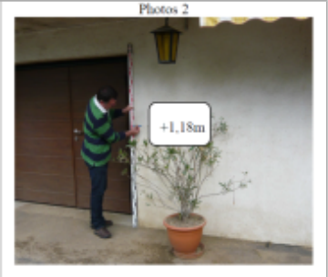
Trace sur la façade à coté de la porte de garage du 41 Ter Grande Rue

SOURCE DE REPÉRAGE : DDT 54 (MAI 2012) - 22/05/2012 Type de repérage : Campagne de terrain post-inondation