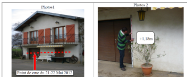
Trace sur la façade à côté de la porte de garage du 41 Ter Grande Rue

Texte : 41 Ter Grande Rue Maximum de l'inondation : Oui