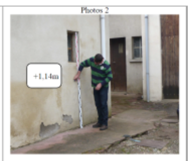
Trace du maximum de la crue sur le crépis du 41 Bis Grande Rue

MARQUE Texte : 41 Bis grande Rue Maximum de l'inondation : Oui