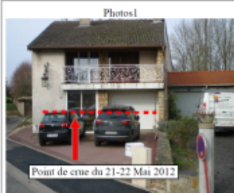
Point de crue du 21-22 Mai 2012

Altitude calculée de l'eau (en m) : 225.67 m