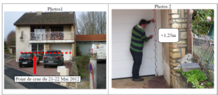
Trace du maximum de la crue au coin de la porte de garage au 43 Grande Rue

MARQUE Texte : 43 Grande Rue Maximum de l'inondation : Oui