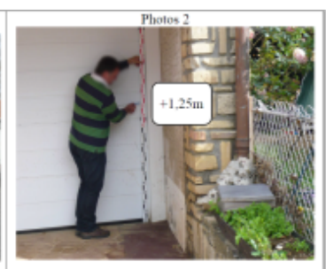
Trace du maximum de la crue au coin de la porte de garage au 43 Grande Rue

SOURCE DE REPÉRAGE : DDT 54 (MAI 2012) - 22/05/2012 Type de repérage : Campagne de terrain post-inondation