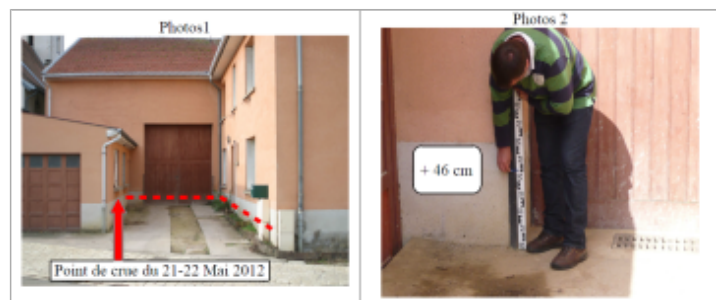
Trace du maximum de la crue sur le crépis au niveau de la porte du garage du 6 rue Frederic Mistral