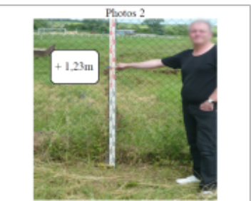
Trace sur la clôture du terrain de foot

SOURCE DE REPÉRAGE : DDT 54 (MAI 2012) - 22/05/2012 Type de repérage : Campagne de terrain post-inondation