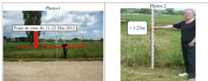
Trace sur la clôture du terrain de foot

Texte : Terrain de foot Maximum de l'inondation : Oui