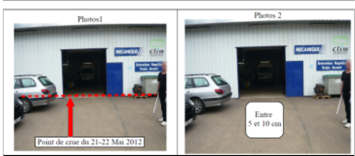
Entrée du Garage Auto-Import du Piroué

GÉNÉRAL Code : WEB_R_201810192010 Date de mise à jour : 09/11/2018 Auteur : DDT54_PR-GC_MH