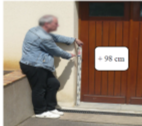
+ 98 cm

Trace du maximum de la crue au niveau de la porte du garage du 6 rue Frederic Mistral