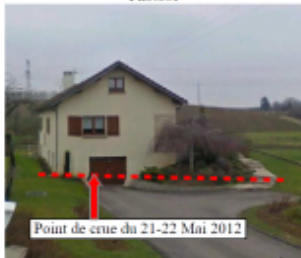
Point de crue du 21-22 Mai 2012