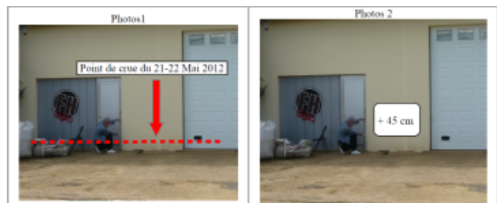
Trace du maximum de la crue sur la façade de la maison rue Jules Vernes

MARQUE Texte : Rue Jules Vernes Maximum de l'inondation : Oui