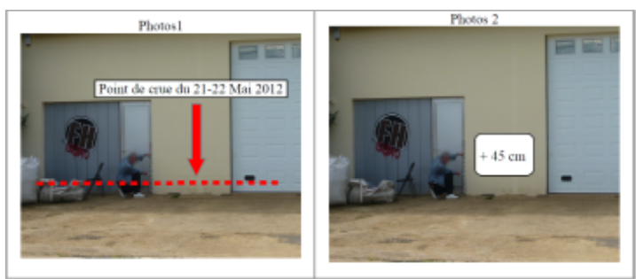
Trace du maximum de la crue sur la façade de la maison rue Jules Vernes

GÉNÉRAL Code : WEB_R_201810192940 Date de mise à jour : 09/11/2018 Auteur : DDT54_PR-GC_MH