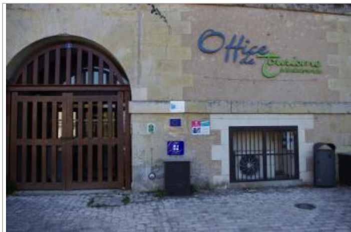
Vue du site depuis la place Abraham Courtemanche