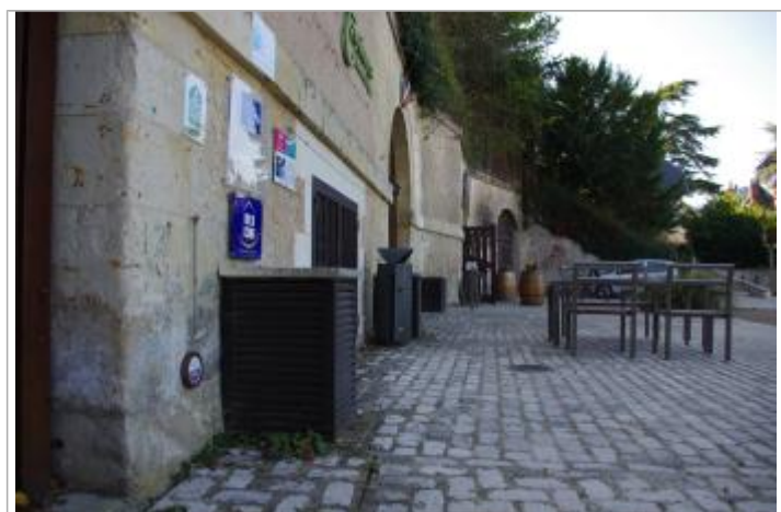
Repère de crue, vue de côté

Texte : mai - juin 1856, plus hautes eaux connues, LOIRE Maximum de l'inondation : Oui Visibilité : Oui État du repère : Bon Pérennité : Longue