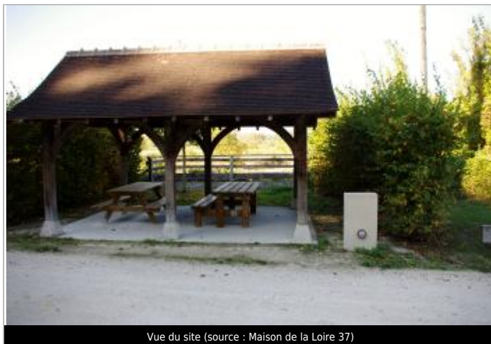
Vue du site