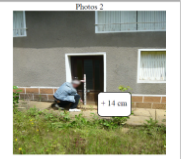
Trace du maximum de la crue sur la porte de l'ancien Moulin route de Laitre sous Amance

SOURCE DE REPÉRAGE : DDT 54 (MAI 2012) - 22/05/2012 Type de repérage : Campagne de terrain post-inondation