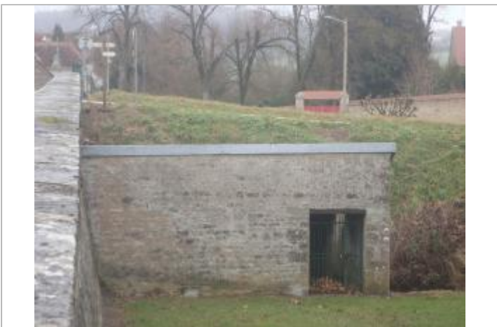
Lavoir de Buffon

GÉOLOCALISATION Coordonnées WGS84 : X: 4.27428690 / Y: 47.64835600 Coordonnées RGF93 (Lambert 93) X: 795662.17 / Y: 6728324.25 Coordonnées RGF93 (ETRS89) : X: 4.2742869 / Y: 47.648356 Code Hydro: F3--0210 Rive de référence: