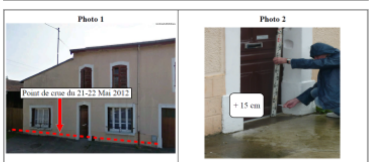
Trace du maximum de la crue sur la porte du 60 rue Saint-Barthelemy

GÉNÉRAL Code : WEB_R_201810180118 Date de mise à jour : 20/11/2018 Auteur : DDT54_PR-GC_MH