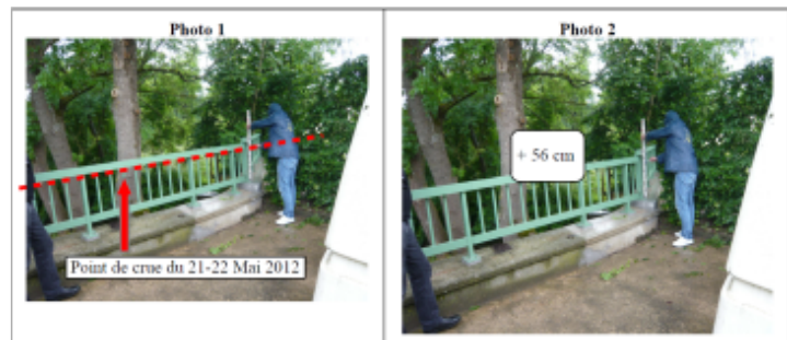
Trace sur la barrière du mur de clôture en amont du Pont sur la RN 74

GÉNÉRAL Code : WEB_R_201810184948 Date de mise à jour : 20/11/2018 Auteur : DDT54_PR-GC_MH