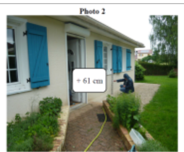
Trace du maximum de la crue sur la façade du 4 rue George Brassens